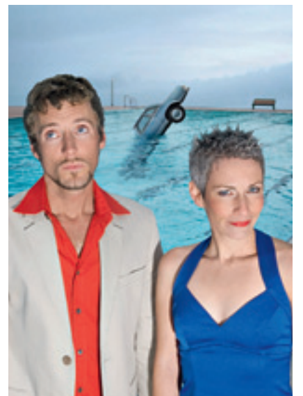
«Zu zweit»: Am heutigen Valentinstag im Schlösslekeller zu sehen.